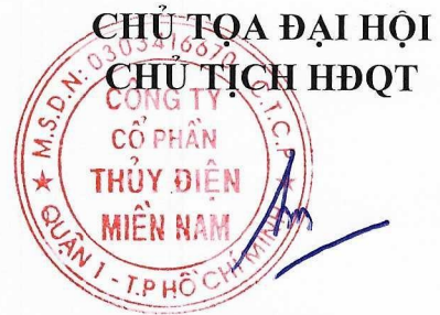
Đoàn Đức Hưng